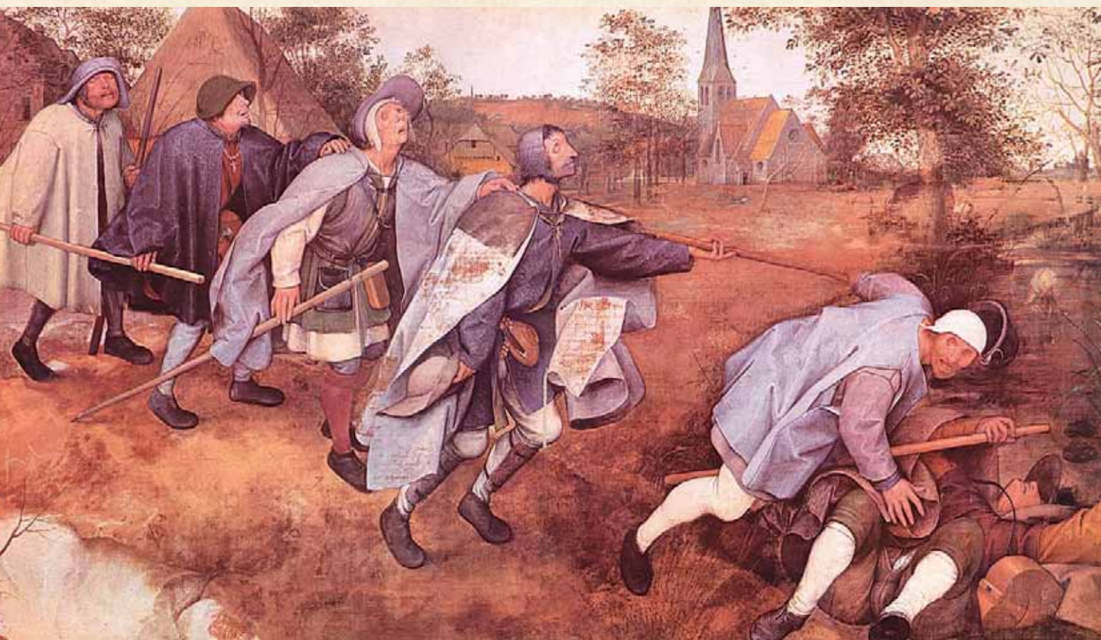
Pieter Bruegel, La parabola dei ciechi, 1568

«Il segno distintivo dell'uomo moderno è lo sradicamento... Il ribelle "sciogliamoci dalla Chiesa" del secolo XVI condusse per intrinseca necessità all'illuministico "rendiamoci indipendenti da Cristo" del secolo XVIII, e di qui al temerario "eliminiamo Dio" del secolo XIX... L'uomo autonomo, perché sciolto dalla soggezione a Dio, e isolato perché scardinato dalla sua comunità, finì per divenire un uomo incerto, sterile, infecondo, estraneo alla realtà, costituito di pura negazione... Quest'uomo non può alla lunga vivere». (K. Adam)