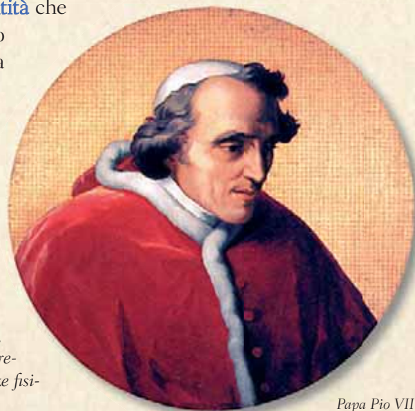
Papa Pio VII

È emblematica la figura del monaco Gregorio Chiaramonti dell'abbazia di Cesena, eletto Papa nel cuore dell'epoca napoleonica (1800) col nome di Pio VII: "In mezzo a quel turbine devastatore solo la sua forte e santa figura pareva rappresentare, per l'ordine monastico e per tutta la Chiesa, una speranza per l'avvenire. Alla caduta di Napoleone, Pio VII, unico fra tutti i sovrani d'Europa, ospitò presso di sé i parenti del despota respinti da tutti, perdonando, nella luce della fede, le angherie e le sofferenze fisiche e morali sopportate". (G. Penco)