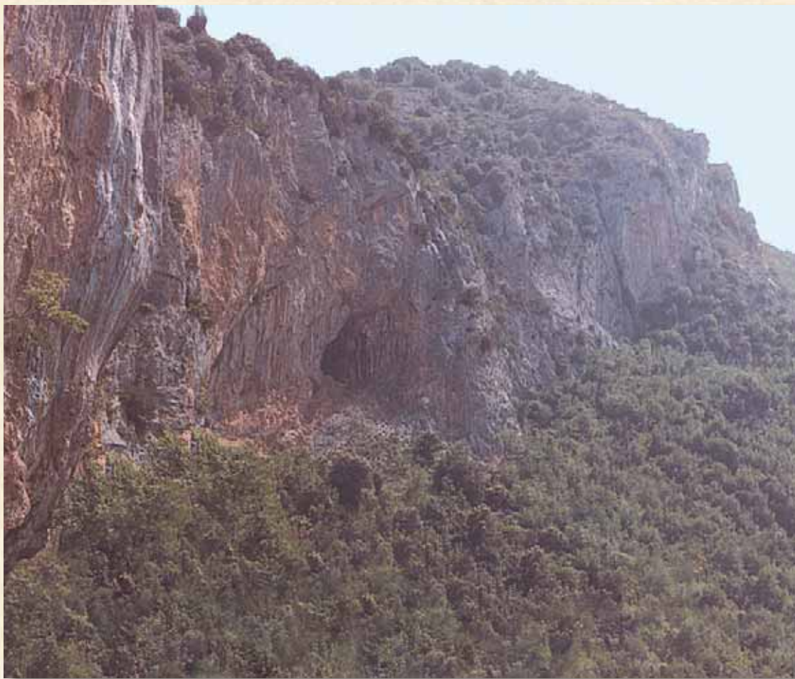
Grotta nei pressi del Sacro Speco, Subiaco

È paradossale che tutto sia nato in quel “buco” tra le rocce, dentro un'assoluta povertà. Vivendo totalmente l'offerta di sé a Cristo davanti agli angeli di Dio, “Benedetto gettò forse senza rendersene conto, il seme di una nuova civiltà” (Benedetto XVI).