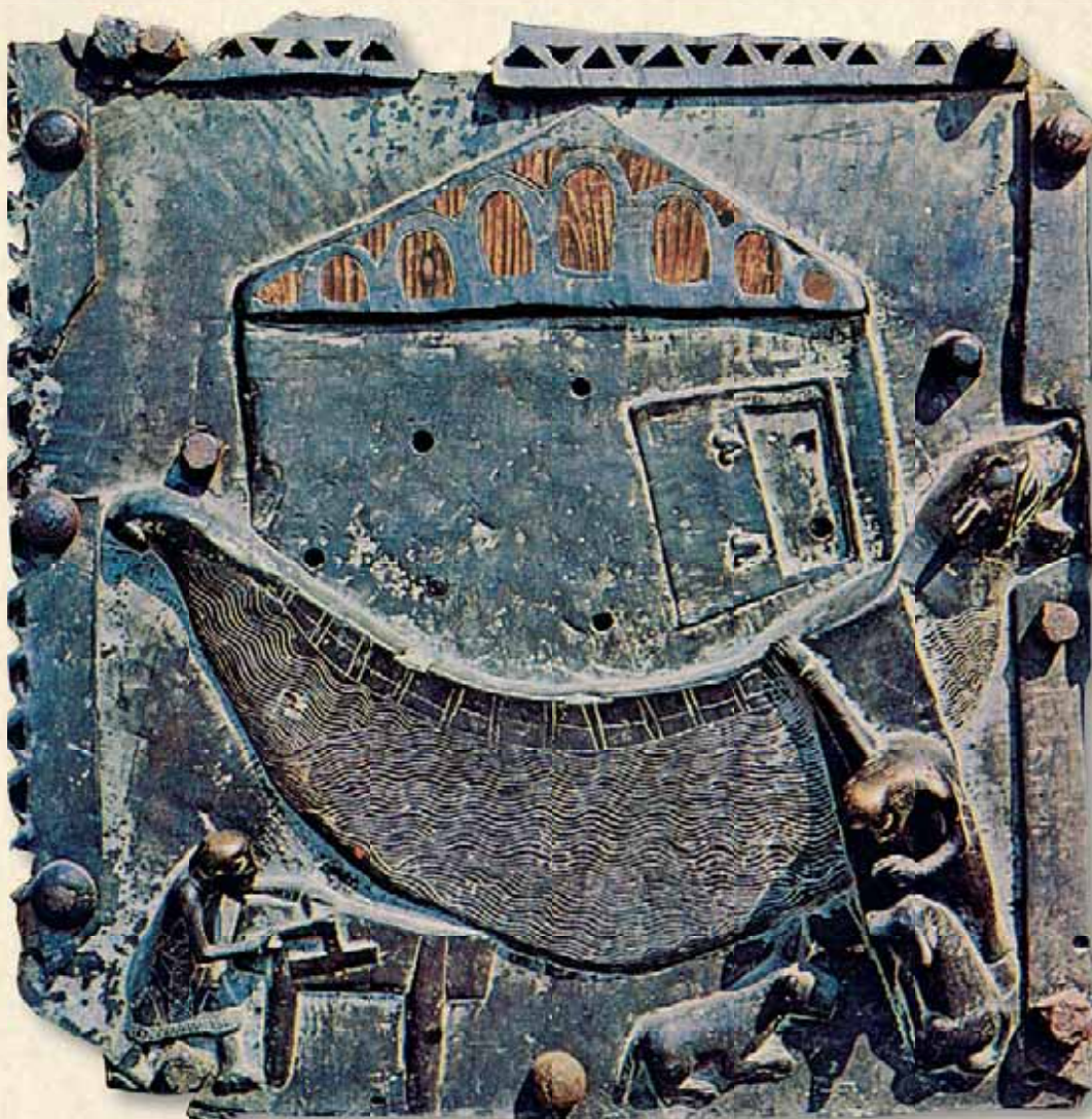
Noè costruisce l'arca, portale di San Zeno, Verona, XII sec.

N onostante la cultura oggi dominante sia una cultura dell'assenza di trascendenza, la Chiesa non mancherà di forza creatrice, come avvenne ai tempi di san Benedetto. Egli non richiamava particolare attenzione a livello dell'opinione pubblica, ma ha fatto qualcosa che indicava il futuro. Sembrava ai margini della realtà, fece qualcosa di strano, tuttavia in seguito questa stranezza si è dimostrata come "l'arca di sopravvivenza dell'Occidente" (J. Ratzinger).