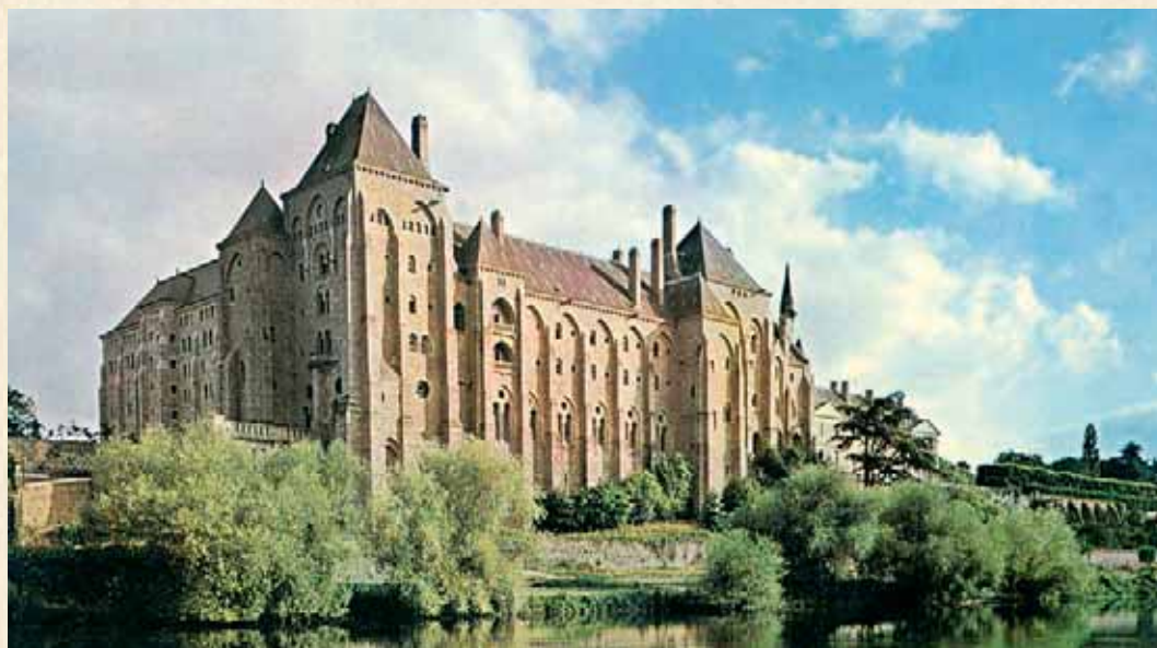
Abbazia di Solesmes

A nzitutto suscitò diversi fondatori e movimenti di riforma che riscoprirono il carisma originale di san Benedetto e furono la risposta vivente dapprima alle ingerenze dei potenti, poi alle negazioni dei protestanti. Nel XV sec. si diffusero le riforme di Kastl e Bursfeld (Germania), Valladolid (Spagna) e Santa Giustina (Italia). Nel '600 sorsero in Francia la congregazione di san Mauro, le Benedettine dell'Adorazione Perpetua e i Trappisti. Dopo le distruzioni del '700 ebbero inizio le congregazioni di Solesmes, Beuron, Sant'Ottilia e Subiaco. Le prime furono al centro di quei movimenti di riscoperta della Bibbia, dei Padri della Chiesa e della Liturgia che prepararono da lontano il rinnovamento della Chiesa promosso dal Concilio Vaticano II.