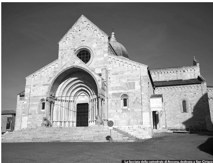
La facciata della cattedrale di Ancona, dedicata a San Ciriaco